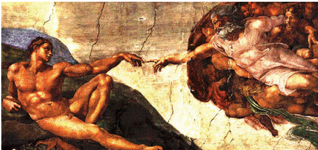
M. Buonarroti: Stvaranje čovjeka , Sikstinska kapela, Rim, Italija (prije obnove)

Veliki umjetnik Michelangelo Buonarroti freskama je oslikao svod Sikstinske kapele u Rimu. Mili-juni ljudi godišnje podižu pogled da bi se divili njegovom remek-djelu. Među freskama osobito se ističe ona na kojoj je prikazano kako Bog Otac stvara Adama. U molitvenom ozračju promotrite taj prikaz prije obnove i nakon obnove.